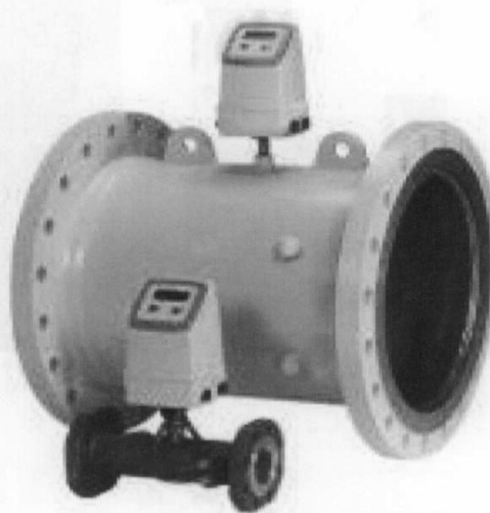
Первичные преобразователи SITRANS FUS380/FUE380