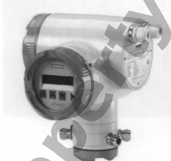
Преобразователь сигналов SITRANS FUS060