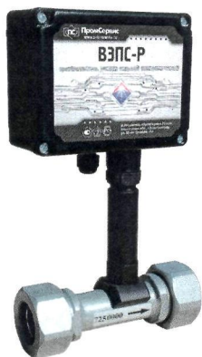
Рисунок 1 – Внешний вид ВЭПС-Р с муфтовым соединением

Внешний вид преобразователей расходов вихревых электромагнитных ВЭПС-Р приведен на рисунках 1 и 2.