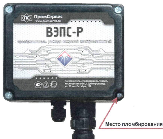
Рисунок 3 – Место пломбирования ВЭПС-Р

В целях предотвращения несанкционированного доступа к узлам регулировки и настройки предусмотрено место пломбирования, указанное на рисунке 3.