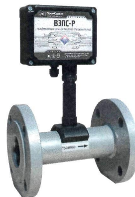
Рисунок 2 – Внешний вид ВЭПС-Р с фланцевым соединением